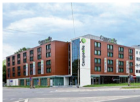
Hotel Campanile Wrocław Centrum Wrocław, ul. Ślężna 26